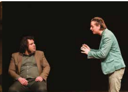
QUESTA SPLENDIDA NON BELLIGERANZA VENERDÌ 18 FEBBRAIO