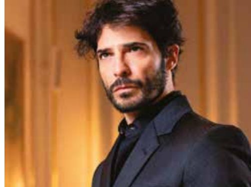
LO ZINGARO VENERDÌ 5 NOVEMBRE