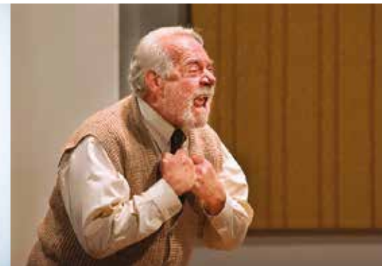
L'UOMO LA BESTIA E LA VIRTÙ SABATO 9 APRILE