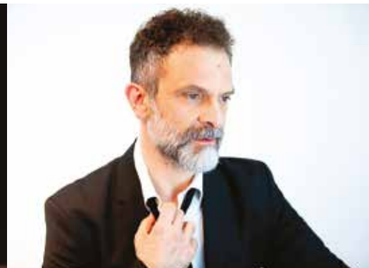
STORIE DI TANGO SABATO 19 MARZO