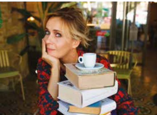
SMARRIMENTO DOMENICA 30 GENNAIO