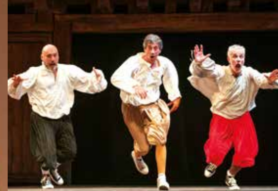
LE OPERE COMPLETE DI SHAKESPEARE IN 90' VENERDÌ 10 DICEMBRE