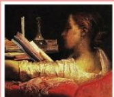
Biblioteca Comunale "Gianni Rodari"

BIBLIOTECA COMUNALE "GIANNI RODARI" VIA SETTEMBRINI SANMARIANO DI CORCIANO (PG) PRENOTAZIONE OBBLIGATORIA TEL. 075/5188291 BIBLIOTECA@COMUNE.CORCIANO.PG.IT HTTPS://WWW.FACEBOOK.COM/BIBLIOTECA.CORCIANO