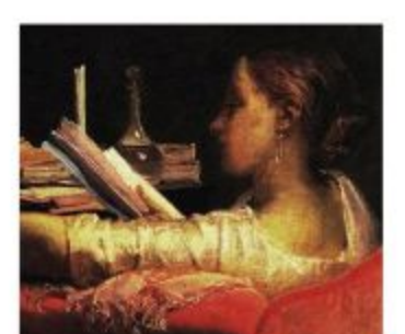
Biblioteca Comunale "Gianni Rodari"

HTTPS://WWW.FACEBOOK.COM/BIBLIOTECA.CORCIANO