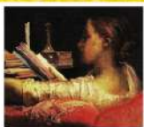
Biblioteca Comunale "Gianni Rodari"

VIA SETTEMBRINI SAN MARIANO DI CORCIANO (PG) TEL. 075/5188291 BIBLIOTECA@COMUNE.CORCIANO.PG.IT HTTPS://WWW.FACEBOOK.COM/BIBLIOTECA.CORCIANO